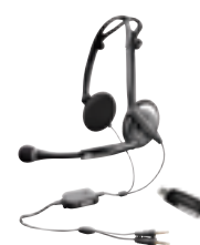
.Audio™ 400 DSP