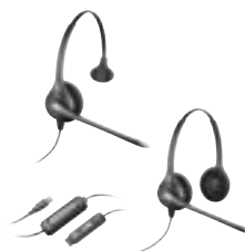
SupraPlus® con DA45™